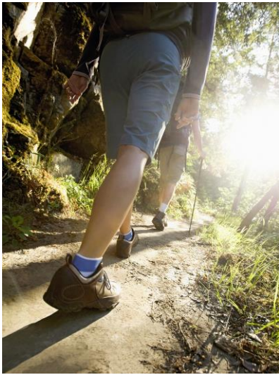
Zehn neue WanderStudienreisen hat Studiosus für die Saison 2016 aufgelegt.

Versteckte Pilgerpfade und charakterstarke Ölmühlen-Besitzer auf Mallorca oder historische Herrenhäuser und endlose Moorlandschaften im Baltikum: Im aktuellen Wanderreisen-Katalog 2016 bietet Studiosus zehn neue Angebote mit der besonderen Mischung aus Natur, Kultur und Begegnungen. Immer mit dabei: Der speziell qualifizierte Studiosus-Reiseleiter, der mehr ist als nur Wanderguide, weil er den Gästen auch Land und Leute besonders nahe bringt. In Europa sind Reisen nach Mallorca, Irland, Norwegen, Estland/Lettland und Kastilien-