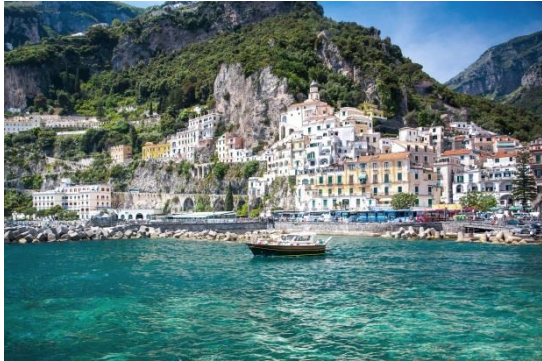
Natur, Kultur, quirlige Städte und ruhige Momente – die Reise „Golf von Neapel - aktiv erleben“ bietet viel Abwechslung.

gemischte Reisegruppe, 24 Natur- und Kulturbegeisterte aus Deutschland, Österreich und der Schweiz - alle mit großer Leidenschaft fürs Wandern. Und tatsächlich lassen sich in den Ausläufern des Kampanischen Apennins, aber auch in der tiefer gelegenen Küstenregion und auf der Insel Capri, jede Menge einsame Wanderwege und